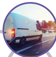
Transport Express / Colis