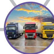
Flottes privées / Logistique de distribution sectorielle