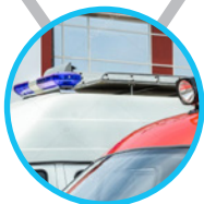
Transport spécialisé (pharmacie, meubles,...)