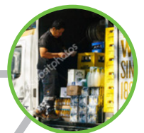
Transport Froid / Agro-alimentaire